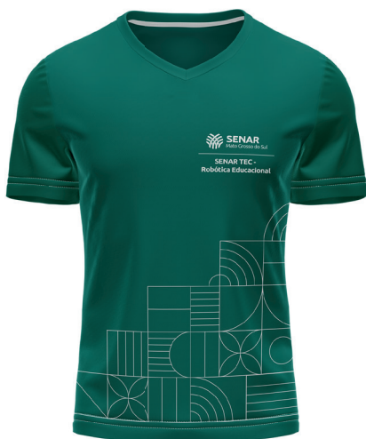
F R E N T E